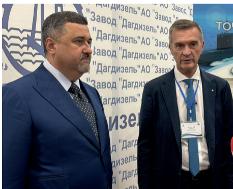
ДАГДИЗЕЛЬ ПОЛУЧИЛ ВЫСОКУЮ ОЦЕНКУ РУКОВОДСТВА РЕСПУБЛИКИ СТР.6